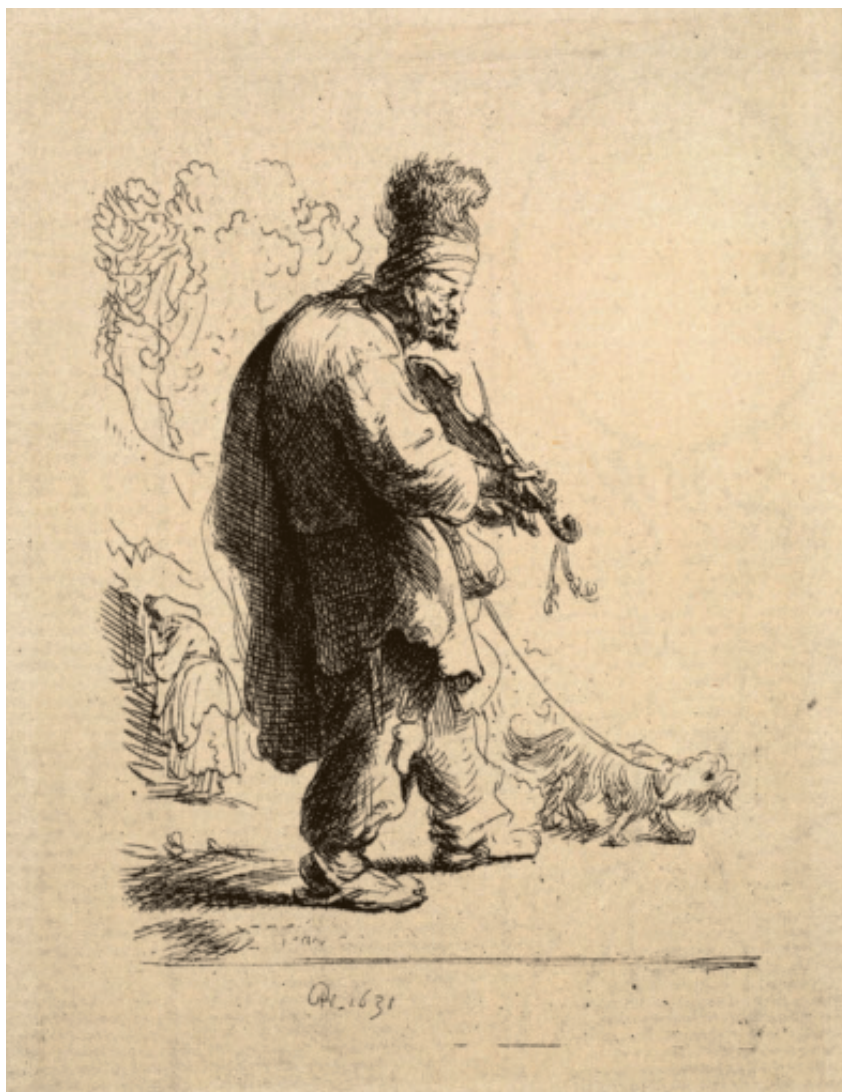
En blind violinspiller med sin hund. Ætsning af Rembrandt Harmenszoon van Rijn (1606-1669) fra 1631.